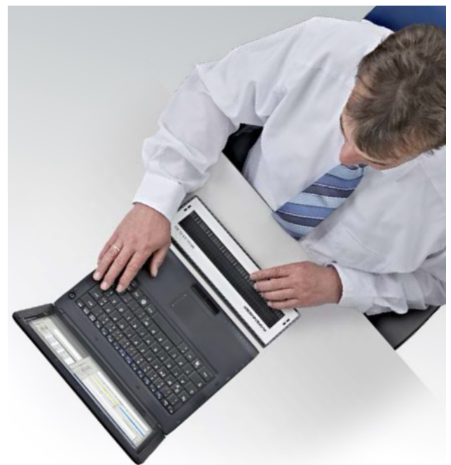
Braillex EL 40c und EL 80c garantieren eine ergonomische Bedienung durch eine patentierte Navigationsleiste!